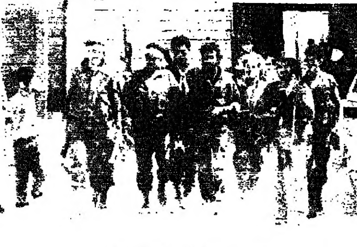
عناصر من القوة ١٧ في عين الحلوة